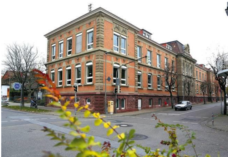
... und Gerbersruhsschule Wiesloch werden zum kommenden Schuljahr Gemeinschaftsschulen.